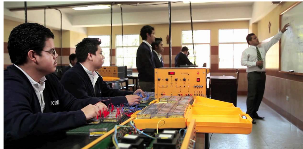
Jóvenes recibiendo una clase en Kinal

Kinal inició sus actividades en 1961 con un grupo de albañiles y carpinteros de un suburbio marginal de Guatemala. El beato Álvaro del Portillo fue su impulsor directo. Actualmente, 1.500 jóvenes reciben una formación técnica que les permite conseguir un trabajo para sacar adelante a su familia.