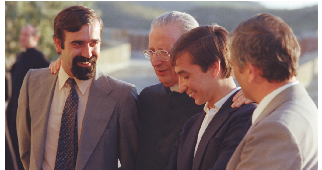
Álvaro del Portillo, en Torreciudad