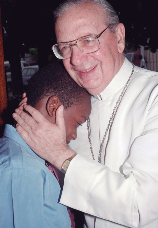
Mons. Álvaro del Portillo, con un chico nigeriano

Jesús, no lo olvidemos, se enternecía ante las muchedumbres que andaban errantes, como ovejas sin pastor, y se preocupaba de cada persona que se cruzaba en su camino”. 3