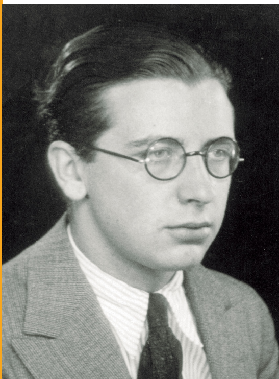
El beato Álvaro, en 1937

A continuación se recogen algunos textos del beato Álvaro del Portillo sobre la etapa de la juventud y la respuesta al compromiso total con la vida cristiana.