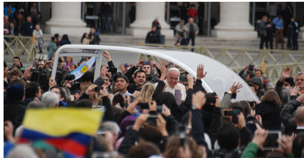
El Papa Francisco, junto a jóvenes de todo el mundo antes de la audiencia del pasado Congreso Universitario Internacional UNIV'2016.

“Queridos jóvenes, tengo el agrado de anunciarles que en el mes de octubre de 2018 se celebrará el Sínodo de los Obispos sobre el tema Los jóvenes, la fe y el discernimiento vocacional. He querido que ustedes ocupen el centro de la atención, porque los llevo en el corazón”. Así comienza la carta del Papa Francisco, fechada el 13 de enero de 2017, dirigida a los jóvenes del mundo, en la que expresa una prioridad clara de toda la Iglesia.