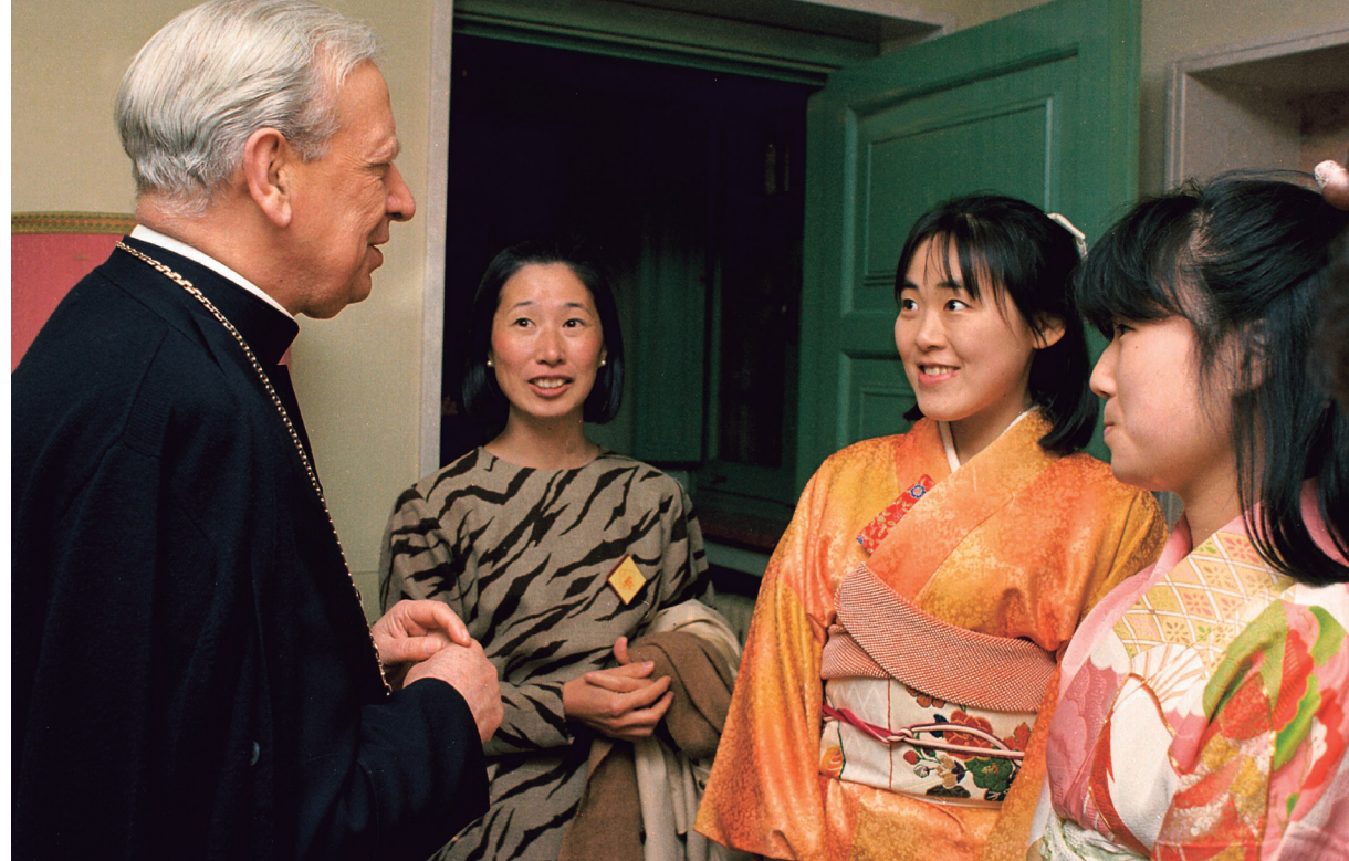
Mons. Álvaro del Portillo, con unas universitarias

“La juventud es la edad del inconformismo, de las rebeldías, de las ansias de todo lo que es bello, y bueno, y noble. Por eso, es joven de verdad quien mantiene vivos en su espíritu estos impulsos (...). El Señor espera vuestra rebeldía juvenil que yo bendigo con mis manos de sacerdote, contra todo lo que intente apartarnos del cumplimiento de la ley de Cristo, que es un yugo suave y ligero. Rebelaos contra los que pretenden inculcaros una visión materialista de la vida. Rebelaos contra los que intentan apagar, con mentiras que narcotizan el espíritu, vuestras ansias de verdad y de bien. Rebelaos contra los torpes mercaderes del sexo y de la droga, que tratan de enriquecerse